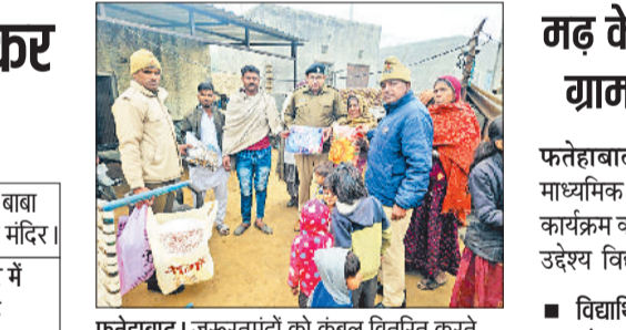
फतेहाबाद। जरूरतमंदों को कंबल वितरित करते बड़ोपल पुलिस चौकी के कर्मचारी।