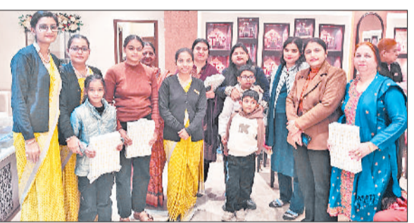
सिरसा। ग्राहक मिलन समारोह में हिस्सा लेते प्रतिभागी।

सांसद सैलजा ने कहा कि ये केवल महात्मा गांधी राष्ट्रीय ग्रामीण रोजगार गारंटी अधिनियम (एमजीएनआरजीए) का नाम बदलने का मामला नहीं है, बल्कि गरीबों के अधिकारों से नफरत करने वाली सरकार ही एमजीएनआरजीए पर हमला करेगी। कांग्रेस पार्टी इस अहंकारी सरकार के किसी भी गरीब-विरोधी और मजदूर-विरोधी फैसले का आम जनता के बीच पहुंचकर सड़कों पर कड़ा विरोध करेगी। कांग्रेस इस सरकार को लाथी गरीब लोगों, मजदूरों और कामगारों के अधिकारों को छीनने की अनुमति नहीं देगी। सांसद सैलजा ने कहा कि महात्मा गांधी का नाम हटाने के पीछे सरकार की क्या मंशा है जो न केवल भारत में बल्कि दुनिया में सबसे बड़े नेता माने जाते हैं। जब भी किसी योजना का नाम बदला जाता है तो कार्यालयों, स्टेशनरी में इतने बदलाव करने पड़ते हैं, जिसके लिए पैसा खर्च होता है।