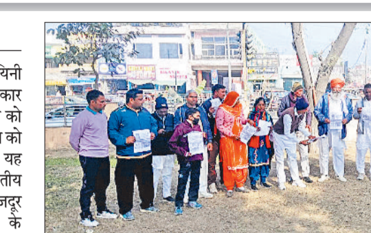
फतेहाबाद। 'वीबी जी राम जी' कानून की प्रतियां जलते विभिन्न संगठनों के सदस्य।

होकर जिस प्रकार से मनरेगा कानून को खत्म किया गया, ये गरीबों के अधिकार पर सबसे बड़ा हमला है इस हमले का मुकाबला करने के लिए पूरे देश भर में सड़कों पर उतर कर प्रतिरोध किया जाएगा।