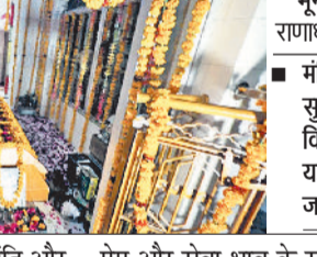
भूना। बाबा राणाधीर मंदिर। मंदिर में सुबह विधिवत यज्ञ किया जाएगा