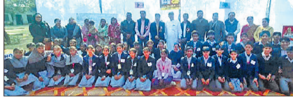
सिरसा। पिपली स्कूल में गठित ग्राम पंचायत के साथ स्टाफ सदस्य व गांववासी।