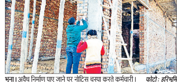
भूना। अवैध निर्माण पाए जाने पर नोटिस चर्या करते कर्मचारी।