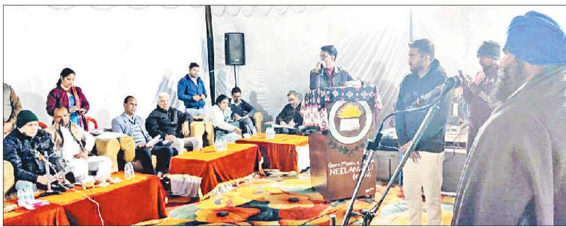
सिरसा। गांव नीलावाली में रात्रि ठहराव में ग्रामीणों की समस्याएं सुनते एडीसी।

ग्रामीणों द्वारा गांव में बस सुविधा न होने संबंधी समस्या को प्रमुखता से रखा, जिस पर अतिरिक्त उपयुक्त ने जीएम रोडवेज को स्थाई समाधान के निर्देश दिए। इसी तरह इंतकाल, अवैध कब्जा हटवाने व सौ-सौ वगैरह के प्लॉटों की निशानदेही