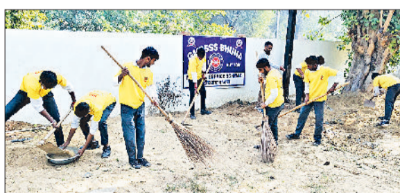
भूना। शिविर के पहले दिन सार्वजनिक व धार्मिक स्थल पर सफाई करते हुए स्वयंसेवक।